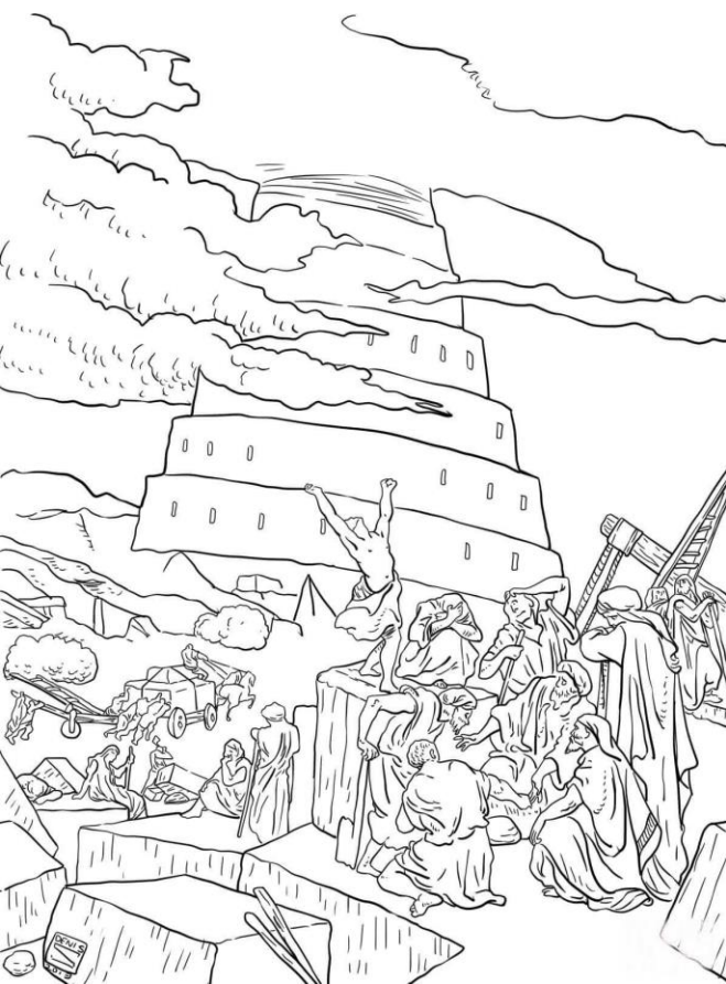
LA TORRE DE BABEL (para colorear)